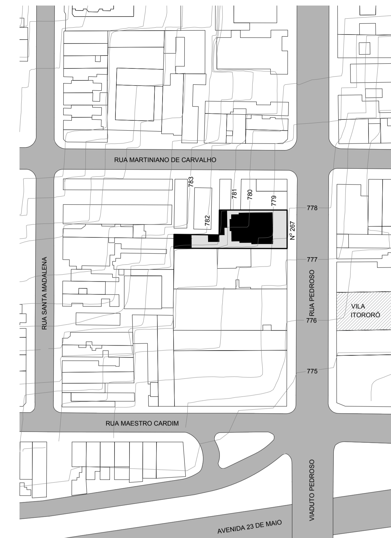
02 PLANTA DE SITUAÇÃO ESCALA 1:1000